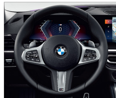
M多功能真皮方向盤 (含換檔撥片)