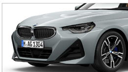
220i M Sport