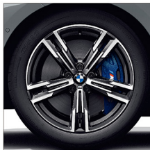
M 雙輻式 848M