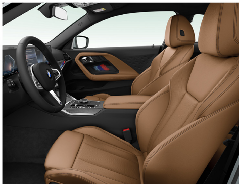
Sensatec 透氣皮質 / 跑車座椅 220i M Sport