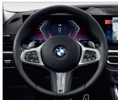
M多功能真皮方向盤 (含換檔撥片)