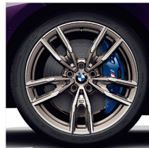
M 雙輻式 792M