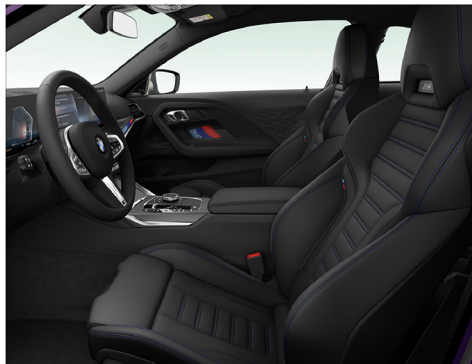
Vernasca 真皮 / M 跑車座椅 M240i xDrive